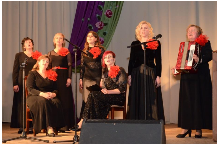
Scenoje Tauragnų moterų ansamblis