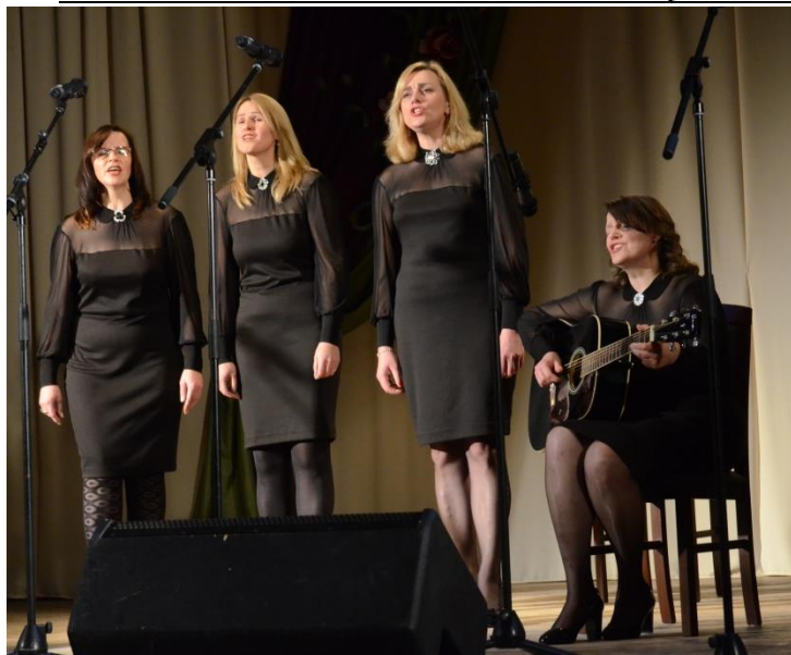
„Vėtrungė” žiurovams patiko labiausiai