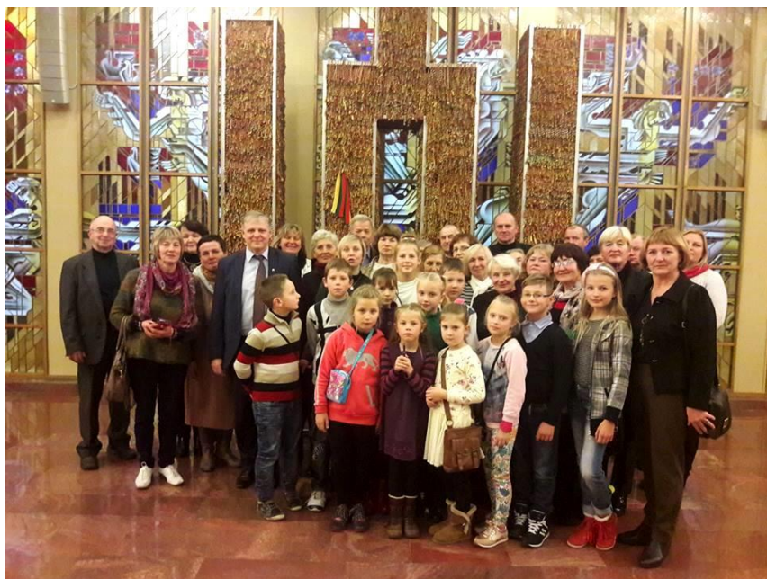
Tauragniškių grupė su Seimo nariu Edmundu Pupiniu

liatoriumi. Dabar pastatė įsikūręs Genocido aukų muziejus, Lietuvos ypatingasis archyvas, kuriame saugomi buvusio KGB archyvo dokumentai, Lietuvos gyventojų genocido ir rezistencijos tyrimo centras ir teismai.