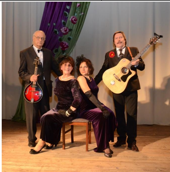
Grupė „Randevu“ iš Kauno