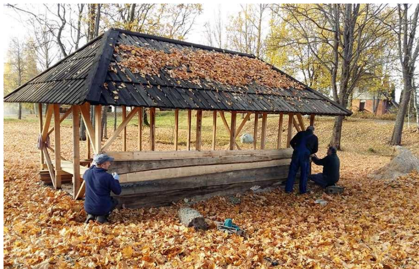
Darbai Klykių bendruomenėje

Bendras darbas stiprina kaimyniškus ir bendruomeninius ryšius tarp gyventojų. Į bendruomeninę veiklą yra įtraukiami savanoriai, jaunimas, senjorai ir socialinę atskirtį patiriantys asmenys. Jaukios aplinkos kūrimas, gražinimas skatina Klykių kaimo gyventojus jaustis tikrais savo kaimo šeimininkais.