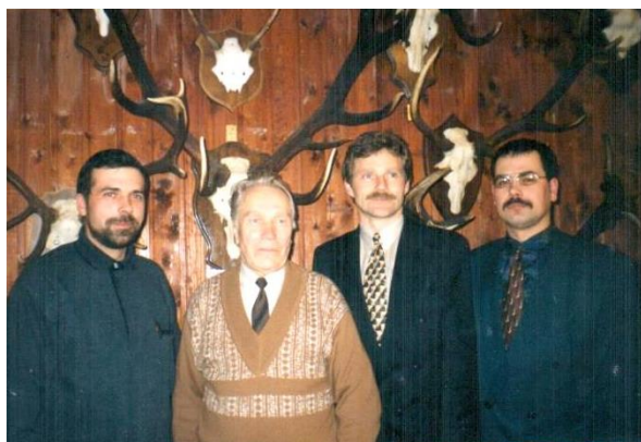
Su Tauragnų medžiotojais

dėl to truputį apmaudu. Seniūno darbas labai įvairiapusis – nėra nė vienos vienodos darbo dienos. Žmonės pas mus geri. Kai pasikalbi su kolegomis, matai, kad ypač priemiestinėse seniūnijose seniūnai turi daugiau visokių problemų. Kasdieniai rūpesčiai – ūkiniai. Dabar žiema, užsninga kelius, sunku privažiuoti autoparduotuvėms, greitajai pagalbai. Todėl dabar svarbiausias rūpestis – kelių valymas. Darbo pradžioje galvojau: kalnus versim, tvarkysimės kaip savo kieme, savo biudžeto lėšas naudosim ten, kur mums atrodys būtiniausia. Tačiau tikrovėje būna visai kitaip. Daug ką riboja Viešųjų pirkimų įstatymas. Iš principo jis labai reikalingas, kad nebūtų pinigai, ypač dideli, iššvaistomi, tačiau įstatymas ir labai apriboja net ir nedidelius pirkimus. Pavyzdžiui, reikia kastuvų sniegui kasti, sutartis sudaroma su pardavėju, kuri pasiūlo mažiausią kainą.