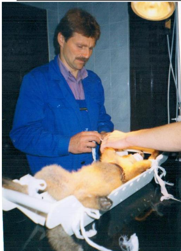
Veterinarijos klinikoje. Pagalba lapiukui.