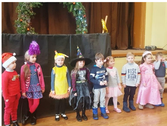
Darželinukų ir mokyklinukų pasirodymai Kalėdų seneliui