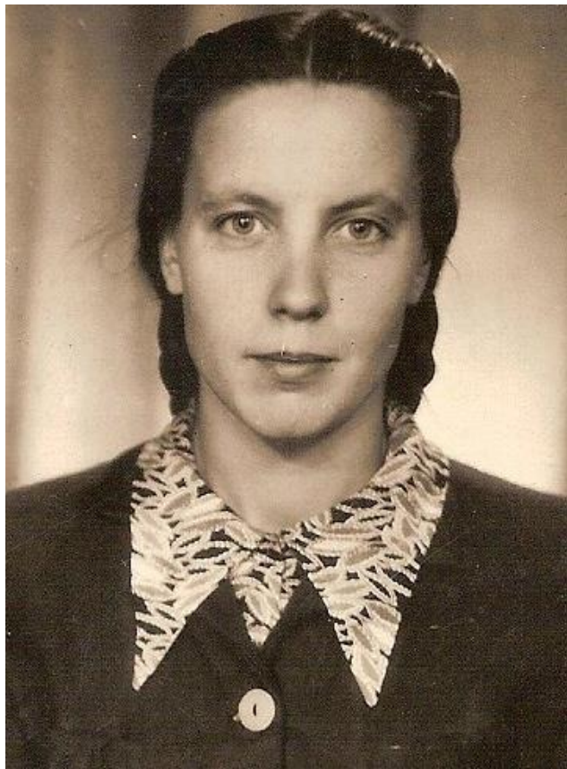
Jaunystėje. 1956 m.