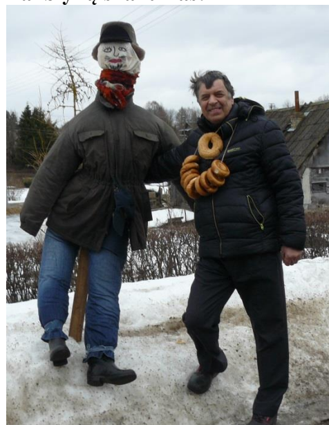
Medžiotojų gatvės Gavėnas buvo sudegintas