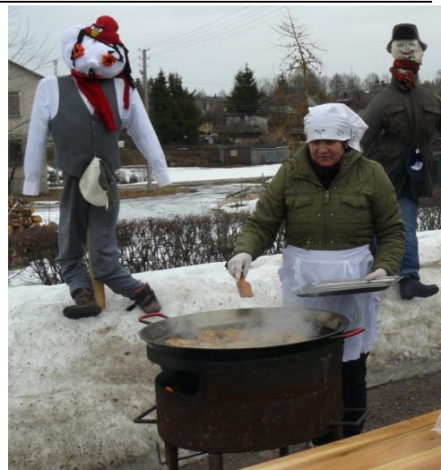
Tai blynų skanumas!