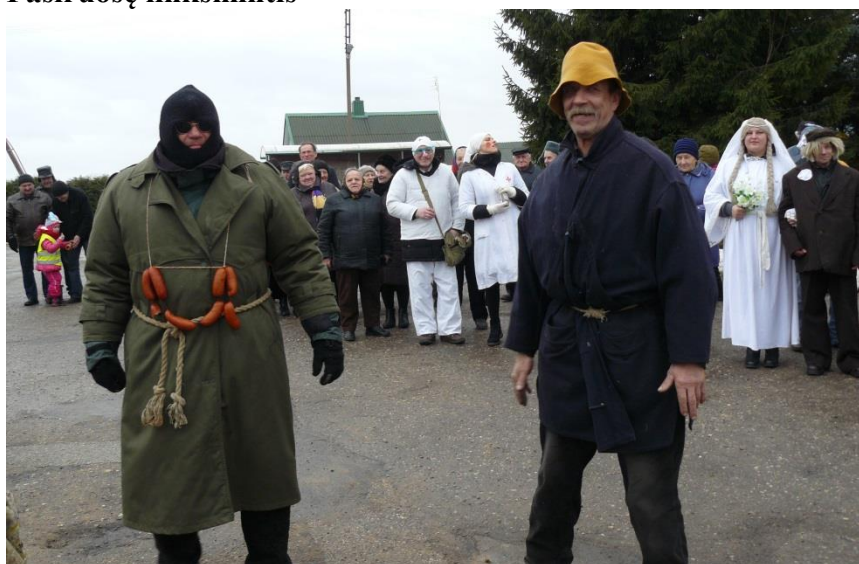
Tuoį susikaus Lašininis ir Kanapinis