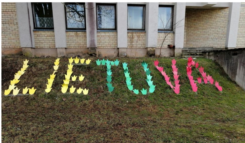
Lietuva pražydo tulpėmis