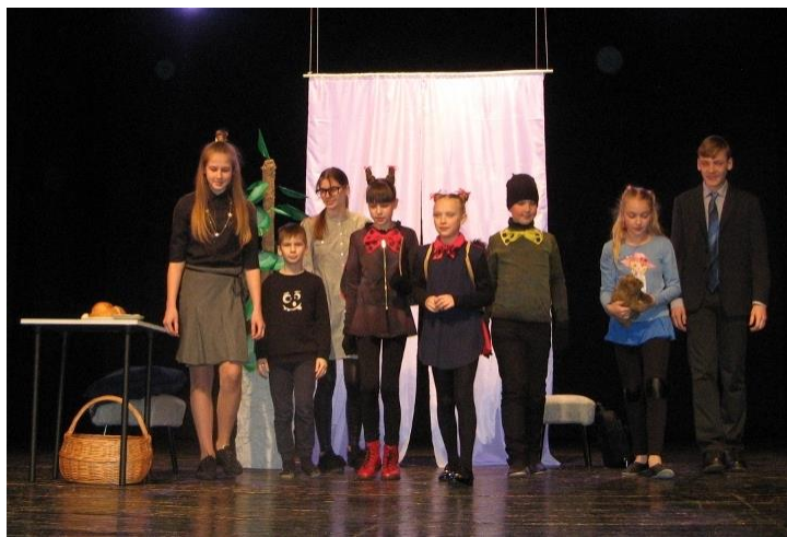
Po spektaklio Pasvalyje