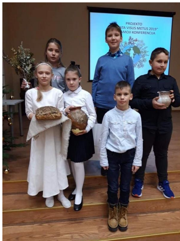
Vilniuje, baigiamojoje konferencijoje

Projekte dalyvavo Lietuvos bendrojo ugdymo mokyklų, formalųjį ugdymą papildančių bei neformaliojo švietimo įstaigų mokinių komandos, vaikų ir jaunimo organizacijos, klubai, būreliai, šeimos. Projekto organizatoriai kiekvieną mėnesį nuo vasario iki gruodžio kvietė leisti į sveikatos