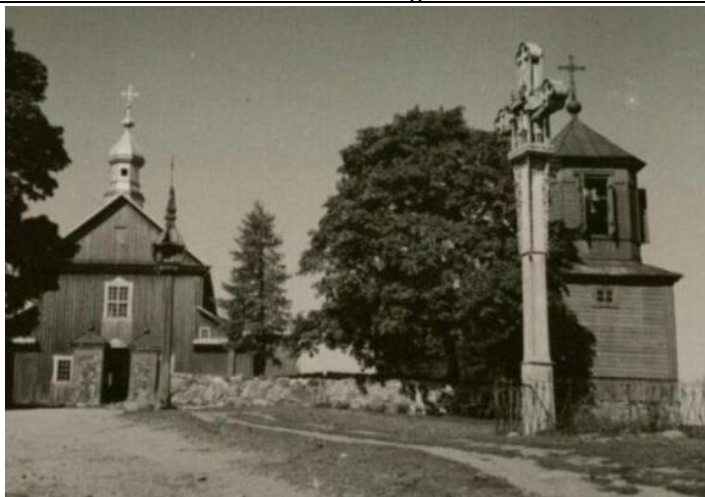
Tauragnų bažnyčia ir varpinė.

https://www.delfi.lt/miestai/utena/mazieji-utenos-rajono-miesteliai-vietiniu-sudegintos-baznycios-ir-stebuklingu-laikytas-saltinelis.d?id=83101553