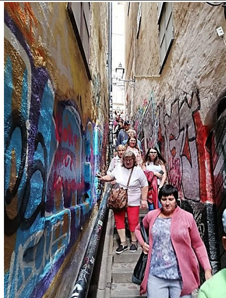
Siauriausia Stokholmo gatvelė