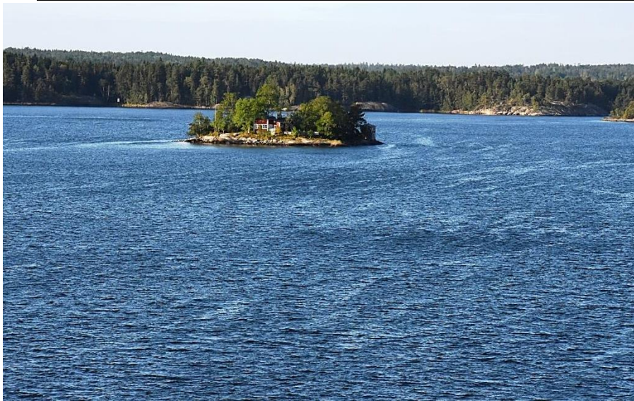
Viena iš daugybės salelių