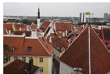
Vaizdas iš apžvalgos aikštelės

Nesiruošiu varginti skaitytojų labai ilgu kelionės aprašymu. Tai bus vienas kitas mano pastebėjimas. Juo labiau, kad rugsėjo viduryje tokiu pačiu maršrutu keliauja kita mūsų grupė – vėl 52 žmonės. Sakyti mūsų gal ne visai tikslu, nes tauragniškių čia bus tik keliolika. Beveik visi norintys tilpo į rugpjūtį. Bet mes džiaugiamės visais, kurie keliauja kartu.