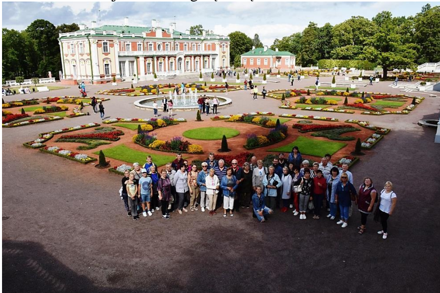
Kadriorgo parkas ir rūmai.