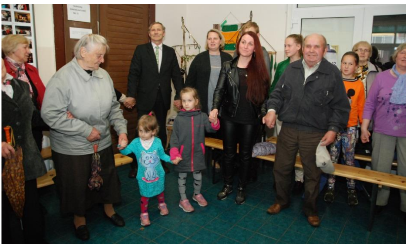
Maži ir dideli susikibo už rankų tradicinei dainai – „Mūsų dienos kaip šventė, kaip žydėjimas vyšnios“