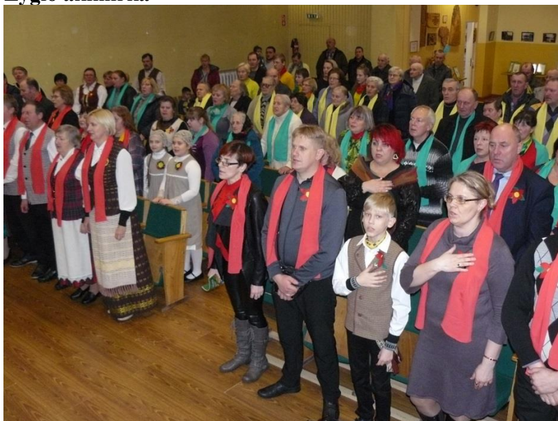
Salėje. Giedame himną.