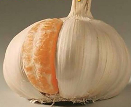
Pamąstymui (iš interneto)

Net jei jūs tinkate, tai dar nereiškia, kad jūs savo vietoje!