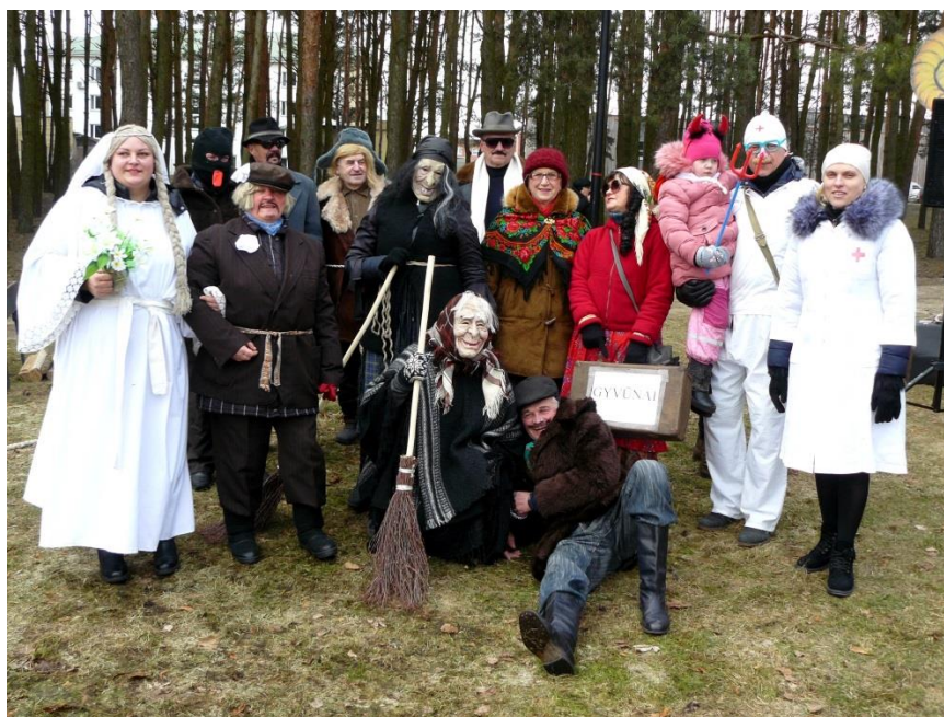
Vasario 24 d. Tauragnų muzikantai, artistai ir prijauciantieji šventė Užgavėnės Utenoje