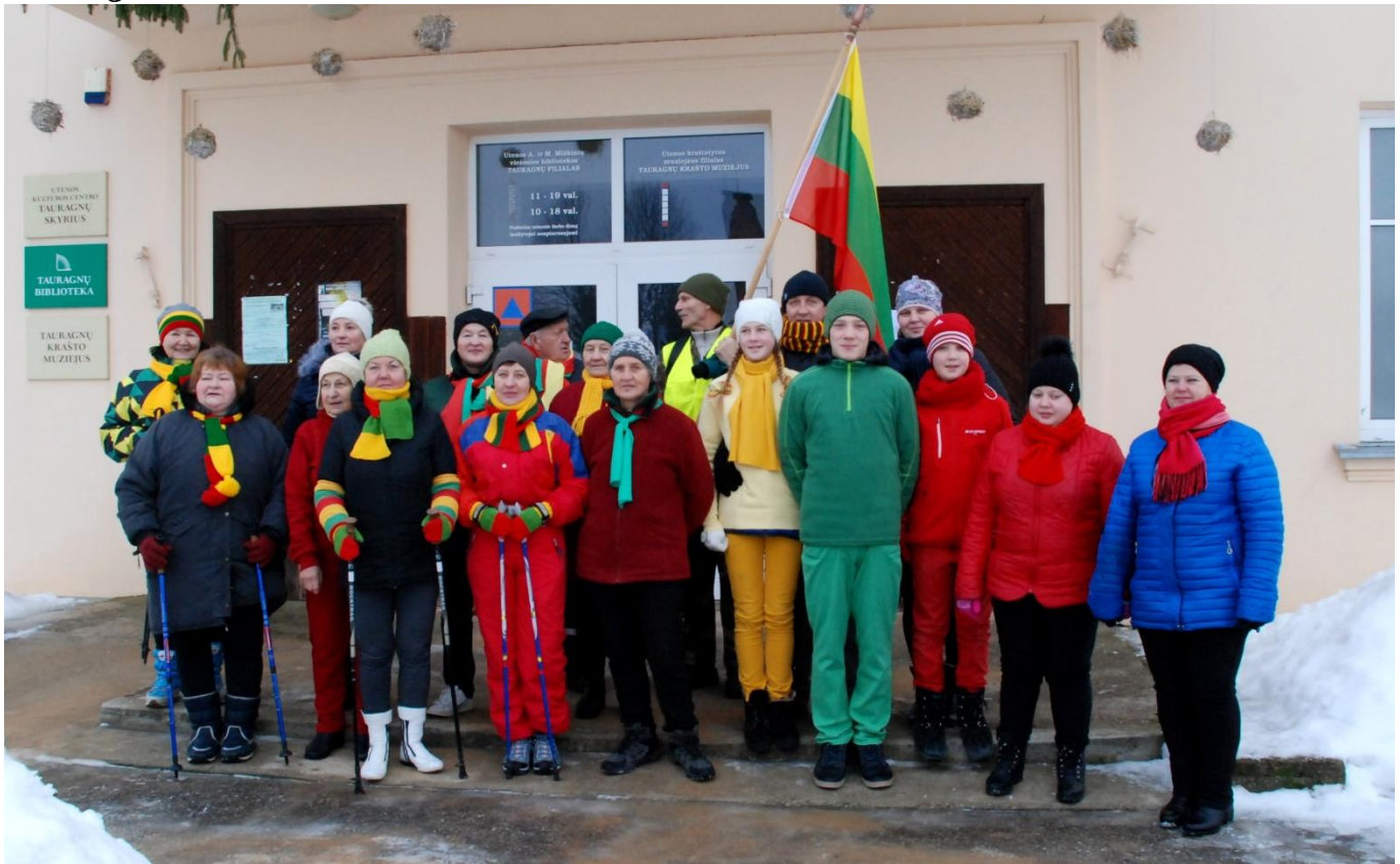
Tauragniškių būrelis žygiui pasiruošęs