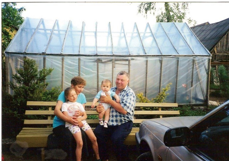
Su dukters Dijanos vaikais, savo anūkais. Dabar jie jau suaugę, dirba.