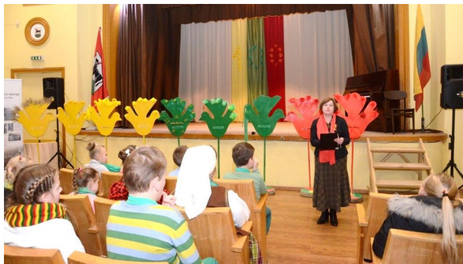
Šimtmečio paukščiai ant savo sparnų „atnešė“ Tauragnų dešimtmečių istoriją