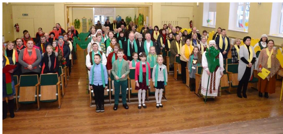
Giedame Tautišką giesmę

Kita diena po vasario 16-osios, vasario 17-a, ir dar kitos dienos buvo tokios pačios. Nutarimas buvo pasirašytas, paskelbtas, bet valstybės jis nesukūrė. Laukė sunkus valstybės pagrindų kūrimo darbas, o vokiečių okupacinė valdžia tik dar labiau sunkino padėtį. Po Nepriklausomybės atkūrimo paskelbimo Lietuvą toliau valdė vokiečiai. Jie reikalavo, kad Lietuvos Taryba paskelbtų amžinąją sąjungą su