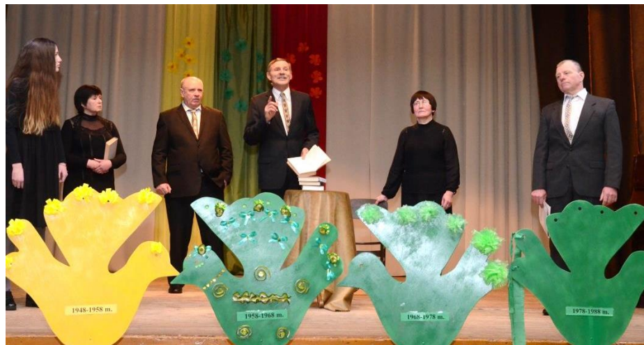
Publicistinė kompozicija „Iš svajonių gimsta tikrenybės“