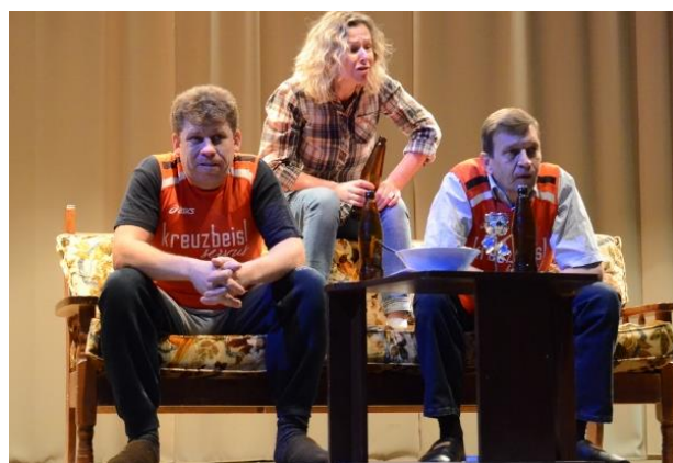
Scena iš spektaklio