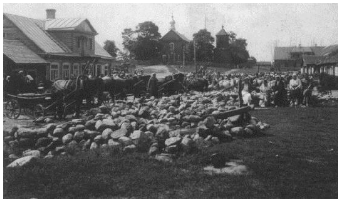
Miestelio aikštė, akmenys gatvėms grįsti. 1934 m.

1935 m. pastatyta nauja medinė mokykla. Iškilo 400 vietų parapijos salė.