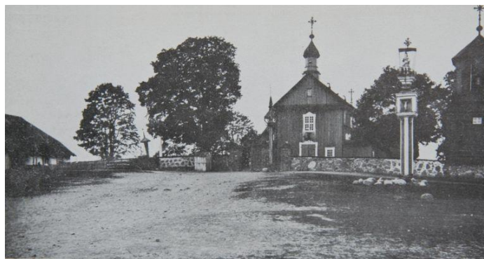
Tauragnų bažnyčia, sudegusi 1944 m.

1944 m. veikė progimnazija, 1945 m. įsteigta biblioteka, 1947 m. ambulatorija pertvarkyta į ligoninę, (veikė iki 1974 m.). Bažnyčia įrengta parapijos salėje.