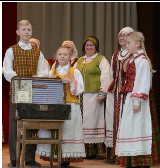
„Iš Žiniuonės skrynios“