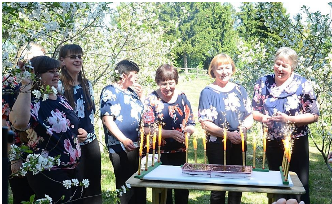
Bendruomenės gimtadienis ir Vyšnių žydėjimo šventė Eugenijos Šimkūnaitės vyšnių sodelyje