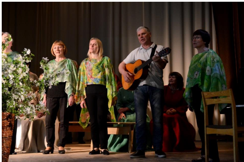
Kompozicija „Kaip žydėjimas vyšnios“