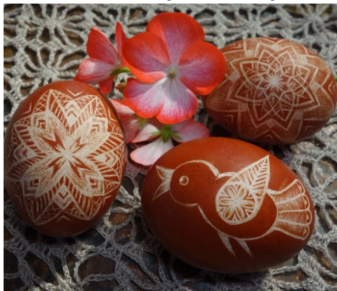
Linos skutinėti margučiai

Kūryba visada yra šalia manęs, mano mintyse, kurti gera... Mane įkvepia mūsų trys vaikai, šeima, gamta, aplinka... Užgimusią idėją ilgai nešiojuosi mintyse – brandinu... Tuomet „mintį“ perkeliu ant balto popieriaus lapo. Piešinį pasidedu savaitei prieš akis ir kiekvieną dieną vis pasižiūriu – dar brandinu. Mano beveik visuose karpiniuose čiulba paukščiai –