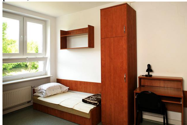
Taip atrodo kambariai

Papildomai lankomi objektai – apie 30 eurų/suaugę, 20 eurų/vaikams (autobuso parkuotės šalia lankomų objektų, Vilko guolis-A. Hitlerio vadavietė, plaukimas laiveliu iš Gdanskio į Sopotą (jei plauksim), Marienburgo pils...)