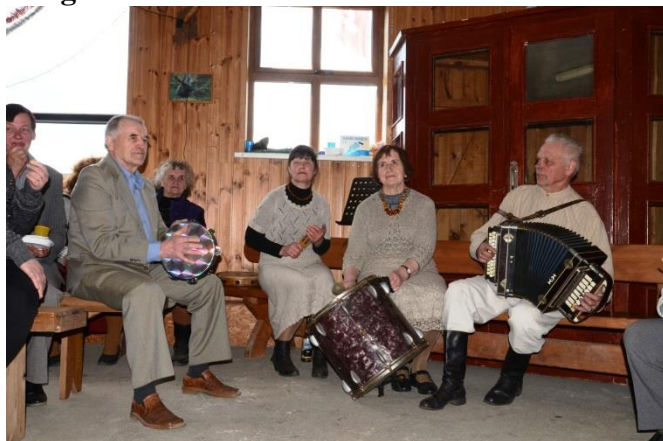
Linksmo kaimo muzikantai