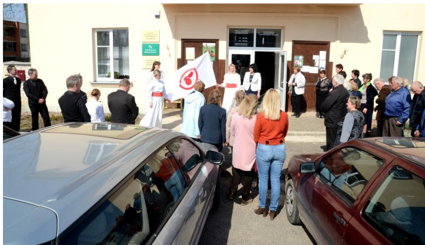
Tuoj bus iškelta Taikos vėliava

Rusų mąstytojas Nikolajus Rerichas daug keliavo po pasaulį ir matė daugybę gražių meno paminklų, kuriuos būtina išsaugoti. Dar 1929 metais jis kreipėsi į visų šalių valstybinius ir meno atstovus, kviesdamas aptarti kultūros paminklų apsaugos klausimą. Jo prašymu prancūzų juristai parengė paktą, kuris buvo paskelbtas įvairiomis kalbomis kartu su N. Rericho kreipimusi.