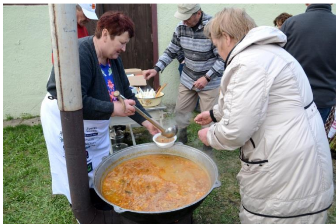
Tai gardi sriuba!