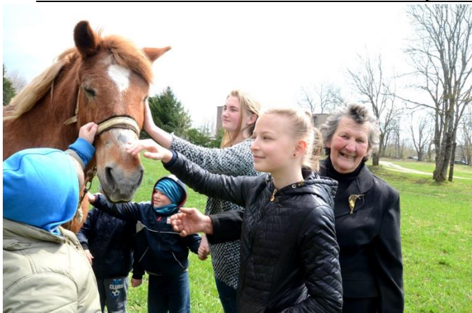
Arkliukas patiko visiems