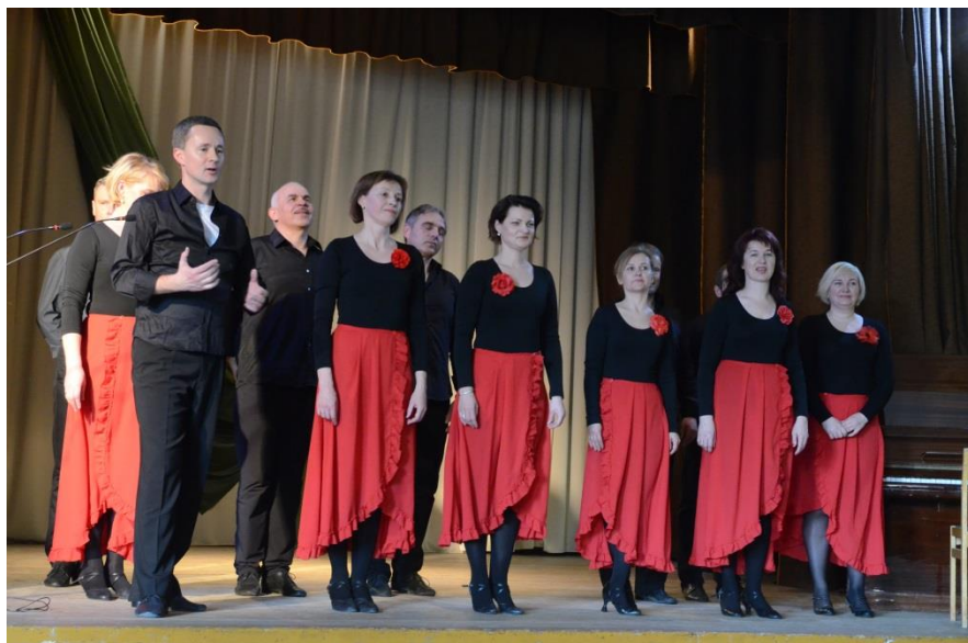
Sportinių šokių kolektyvas „Slingas“

1935 metų balandžio 15 dieną Vašingtone JAV prezidento F. Ruzvelto kabinete 21 Amerikos žemyno šalies atstovai pasirašė sutartį dėl meno ir mokslo įstaigų bei istorinių paminklų išsaugojimo. Simboliu pasirinkta Taikos vėliava – baltame fone raudonos spalvos žiedas, juosiantis tris raudonus apskritimus. Taika amžinybės rate – tai menas, mokslas ir religija, tai tikėjimas, ramybė ir sutarimas, kurie taip reikalingi sudėtingame šiuolaikiniame pasaulyje tarp religijų, tarp kartų, tarp tautų.