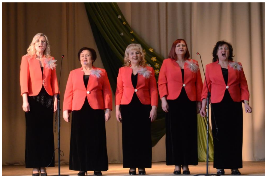
Vyžuonų kultūros skyriaus moterų ansamblis „Versmė“