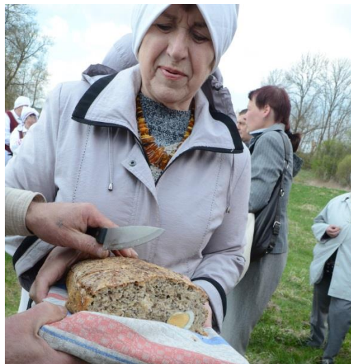
Dalinamės Jurginių duona