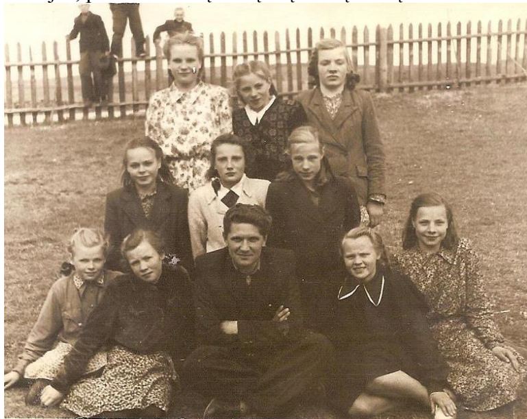
Su auklėtinėmis Tauragnuose apie 1954 m.

Po kariuomenės atvažiavau į Tauragnus, pradėjau dirbti mokykloje, turėjau pamokų ir dieninė, ir vakarinė (tada tokia buvo). Prieš kariuomenę mokiausi Kauno mokytojų seminarijoje, ten ruošė pradinių klasių mokytojus. Į Kauną nebegrižau, mokslus tęsiau Panevėžio pedagoginėje mokykloje neakivaizdiniame skyriuje. Mokslo pasirodė maža – pedagoginiame institute Vilniuje studijavau rusų kalbą ir literatūrą, bet nebaigia, nes literatūra mane smaugė (o dar buvau po sunkios operacijos), todėl įstojau studijuoti istorijos, priėmė iškart į antrą ar į trečią kursą.