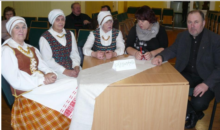
Darbai rimtai nusiteikusi Saldutiškio komanda

Pirmajame ture buvo 10 užduočių su pateiktais 4 atsakymais. Reikėjo išrinkti teisingą. Teko nemažai pasukti galvą, kad galėtum atsakyti. Kai kuriuos atsakymus tiesiog spėjom. Koks didelis džiaugsmas buvo, jei pataikėi teisingai atsakyti. Sunkiausia buvo pasakyti, kiek piliakalnių yra Utenos