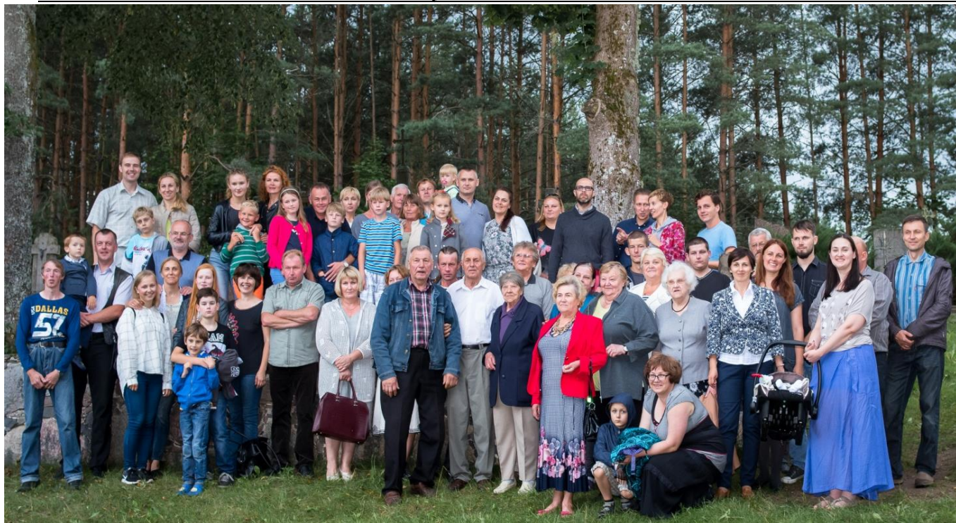
2016 m. rugpjūtis. 50-asis Šinkūnų giminės susitikimas.