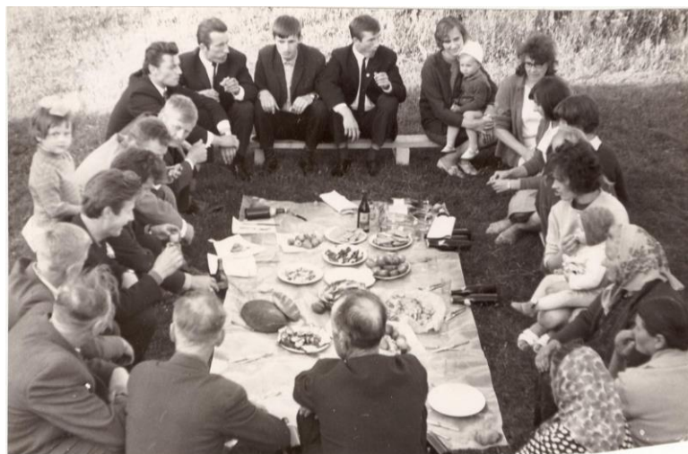
1968 m. Giminės susitikimas Vyžiuose