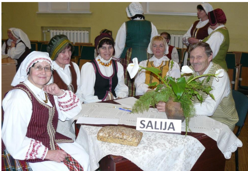
Ši komanda surinko daugiausia taškų

Ketvirtoji užduotis buvo sudaryti kuo daugiau žodžių iš žodžio Aukštaitija raidžių. Salijos ir Saldutiškio komandos sudarė