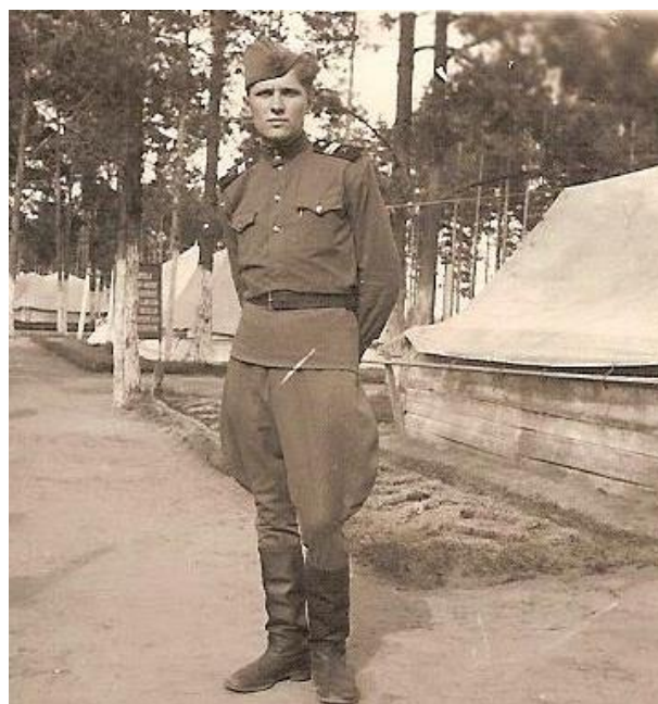
Kariuomenėje Kaliningrado srityje.

Penktą skyrių lankiau Vyžuonose, prisimenu, kaip su žydeliokais dainuodavom. Tokie dainininkai buvo! Būdavo, vienas mane vis namo kviesdavo, arbata vaišindavo. Labai su juo draugavom. 1941 m. mačiau savo draugą paskutinį kartą, kai jau buvo prasidėjęs karas. Taip skaudu prisiminti... Mokykloj buvo daug renginių, dainuodavom ir per juos. Daug