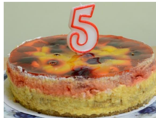
Kapelai „Tauragna“ – penkeri