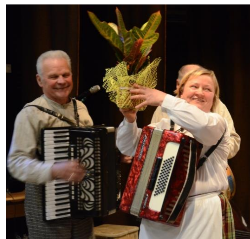
Gėlės kapelos vadovei

Projektas tęsis iki metų pabaigos, tačiau tikimasi, kad Utenos rajono savivaldybė ir kitais metais jį finansuos. Galbūt kaimuose yra ir daugiau žmonių, kuriems reikalinga įvairi pagalba: atnešti malkų, maisto produktų iš parduotuvės, padėti apsitvarkyti namuose ir pan. Būtų gerai, jei apie tai pranešumėte socialinei darbuotojai ar bendruomenės pirmininkei.