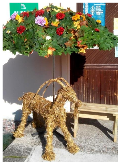
Oželis, kuris bus paaukotas