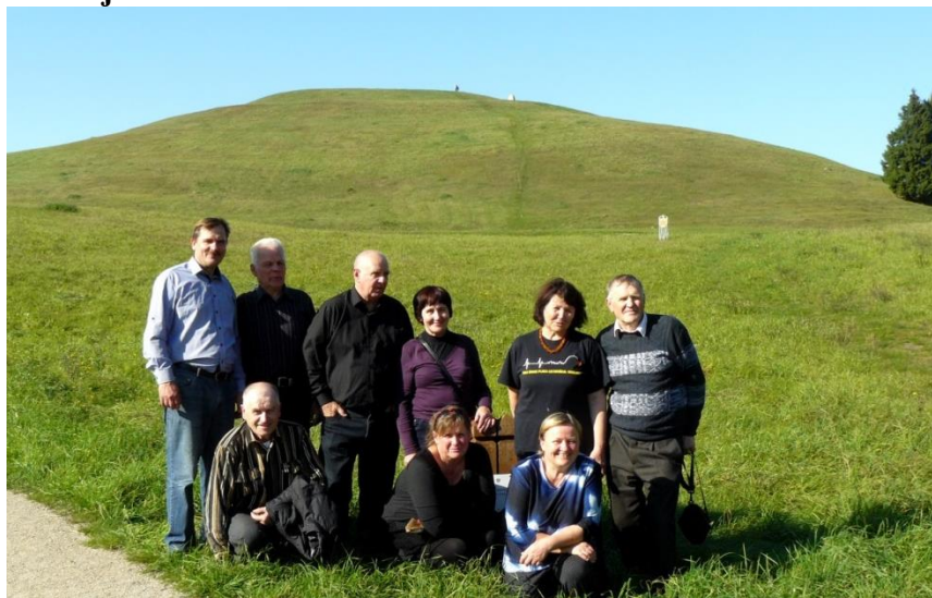
Prie Šatrijos piliakalnio