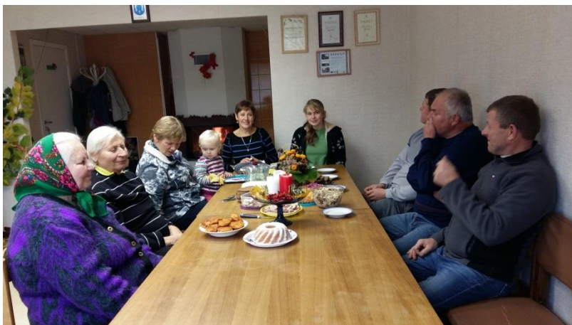
Derliaus diena bendruomenėje

Liepos–gruodžio mėnesį Klykių bendruomenėje vykdomas socialinis projektas – „Specialių socialinių paslaugų teikimas namuose senyvo amžiaus ir suaugusiems asmenims su negalia.“ Projektą finansuoja Utenos rajono savivaldybė iš Utenos rajono savivaldybės socialinių paslaugų plėtros kokybės gerinimo programos ir skyrė 1919 eurų. Šio projekto metu buvo įdarbintas vienas žmogus, kuris teikia socialines paslaugas šešiems žmonėms.