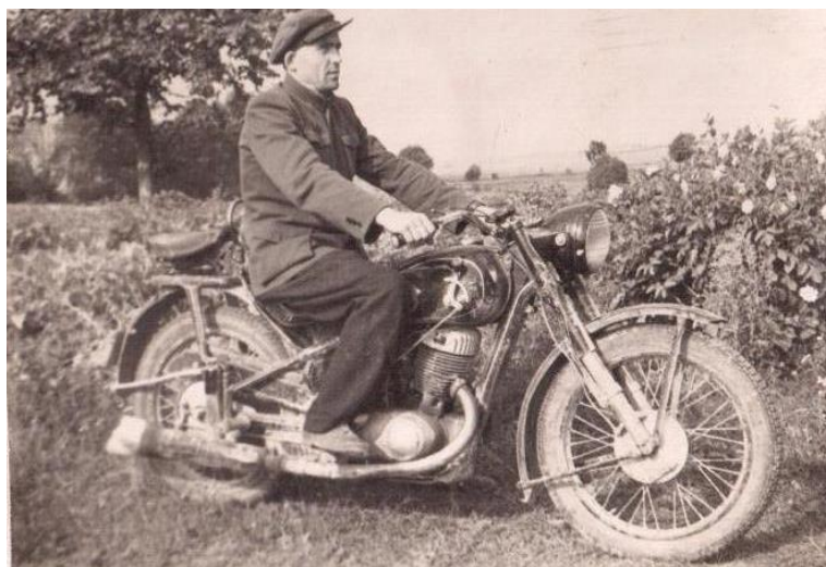
Šiuo motociklu važiuodavo į Švenčionėlius pirkti duonos.