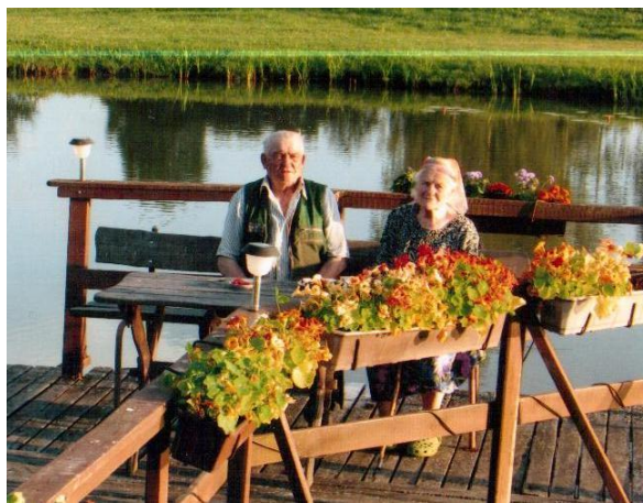
Su žmona, kai dar buvo abu.