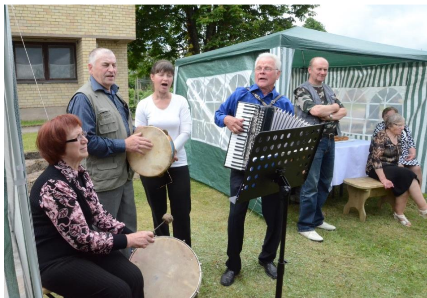
Maleckažemio muzikantai grojo ir dainavo nuo dūšios