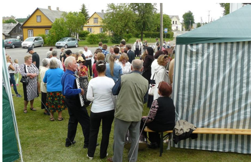
Susitikus smagu pabendrauti