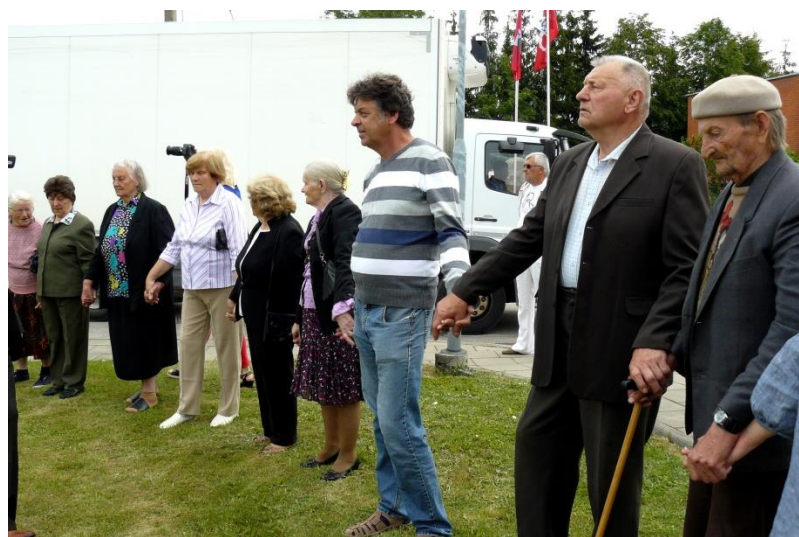
Tvirtai susikibkim už rankų...

Su pagarba Kraštiečių šventės organizatoriams.