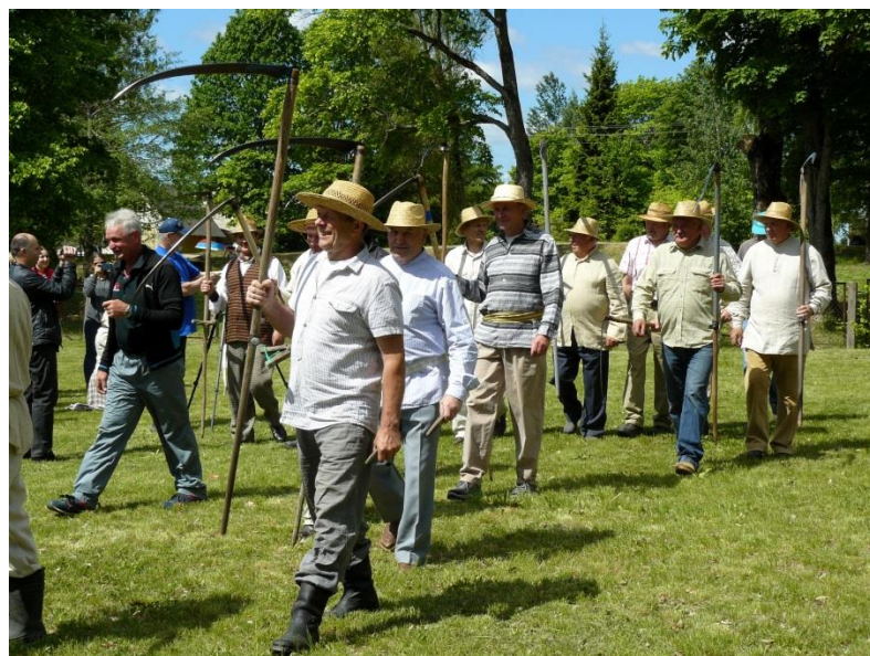
Ir išėjo vyrai į lankas...

Tauragnų bendruomenės projektą „Etninės kultūros ir vietos tradicijų plėtra Tauragnų bendruomenėje“ remia Utenos rajono savivaldybė.