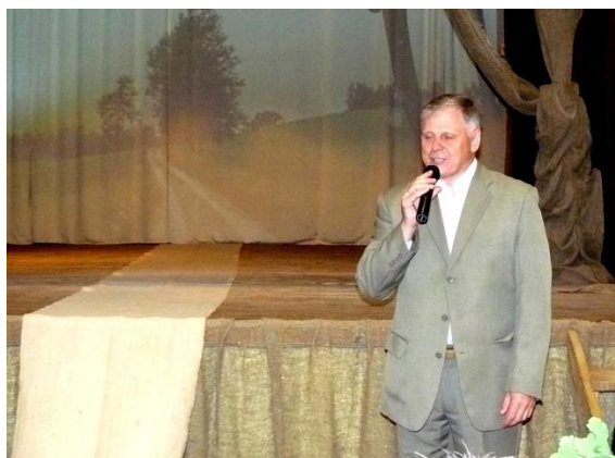
Susirinkusius sveikina Seimo narys Edmundas Pupinis