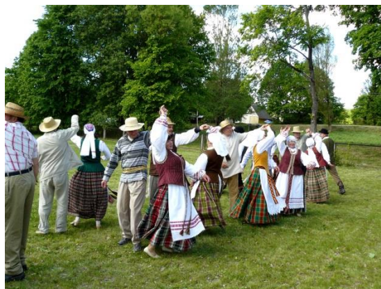
Smagiam šokio sukury