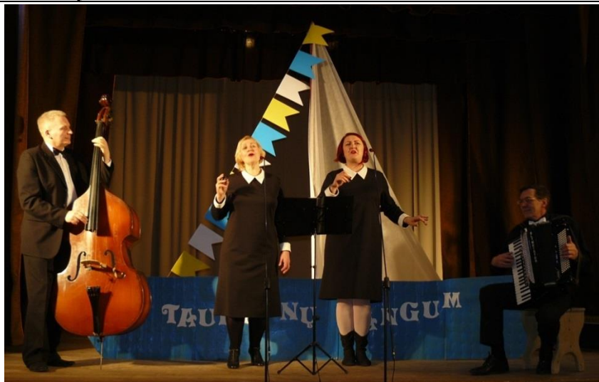
Ansamblis „Trys viename“