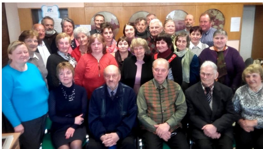
Po knygos pristatymo