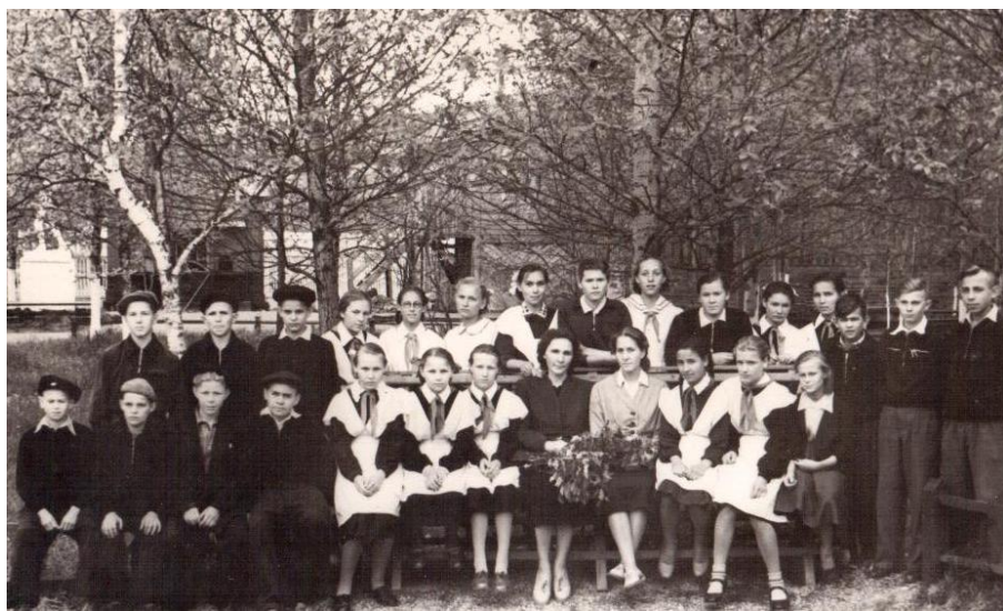
Chabarovsko kraštas. Iš dviejų 7 kl. subūrėm dainos mylėtojų grupę. 1959 m.