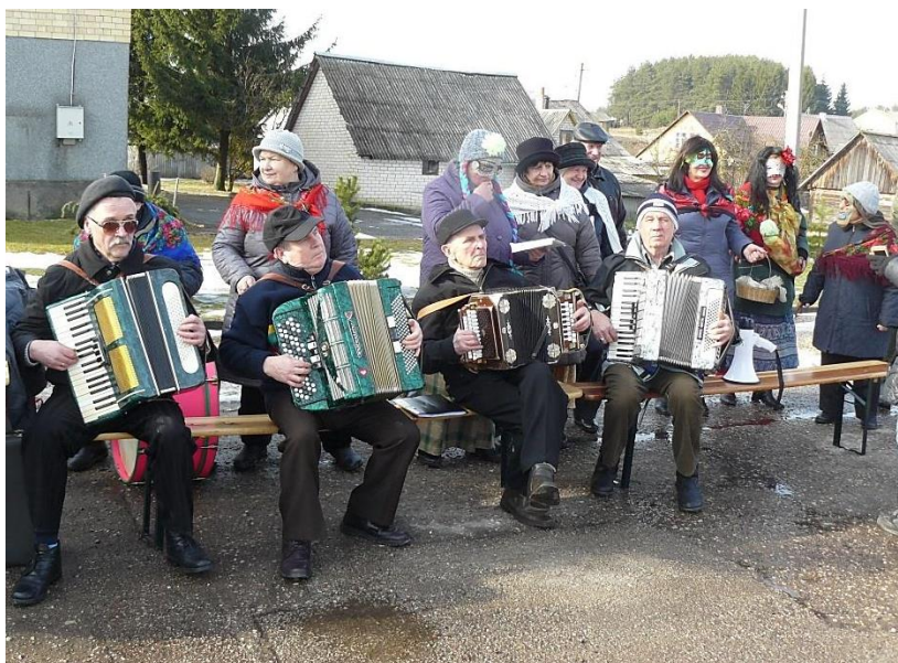
Muzikantai grojo nepailsdami