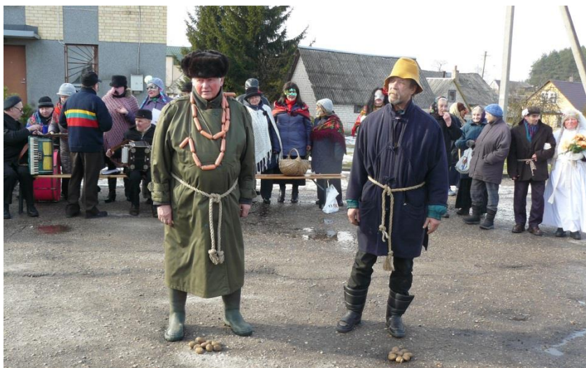
Lašininis ir Kanapinis

Per Užgavėnes ne tik šokome, bet vyko įvairios rungtys: bulvių mėtymas į „kašėlę“, veltinio metimas, kas toliau nusiųs, Kanapinio ir Lašininio kova, virvės traukimas.