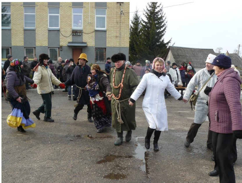
Ir be linksmybių?