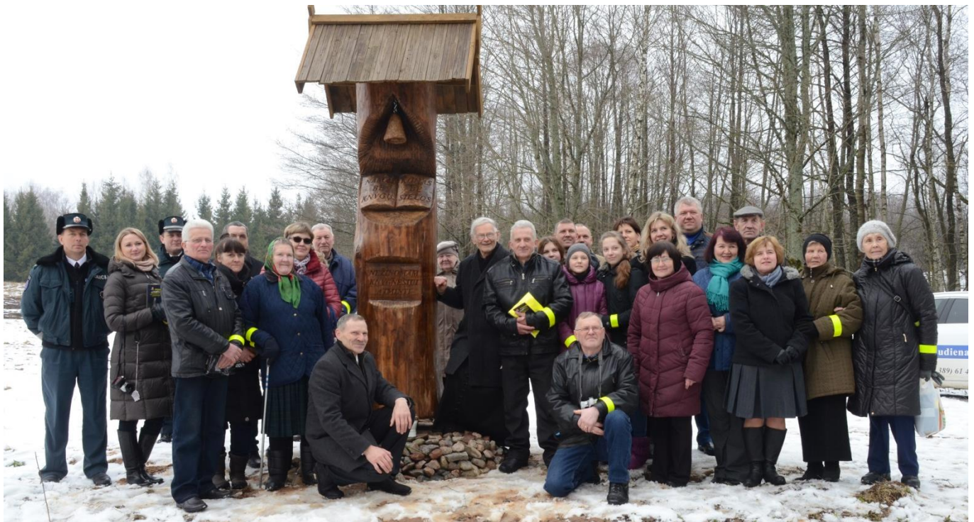
Prie atidengto stogastulpio kovo 11 d.