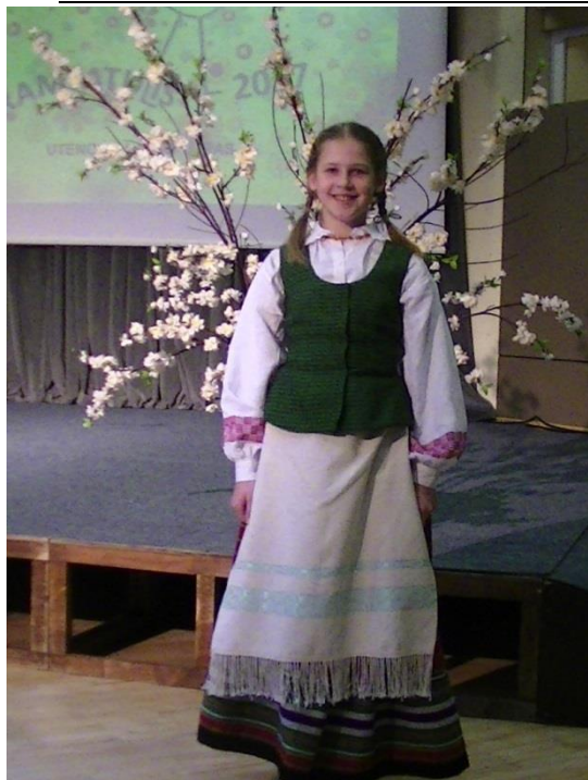
Ada po konkurso Utenoje