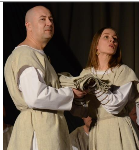
Scena iš spektaklio „Undeniu, ugniu, žalynais“