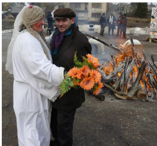
Išpūdinga jaunųjų pora