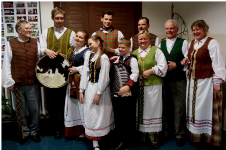
Tauragniškių ir molėtiškių kapelos po koncerto

Lapkričio 12 d. tauragniškių kapela svečių teisėmis dalyvavo Kuktiškėse vykusioje keturioliktoje liaudies kapelų ir muzikantų šventėje „Grok, armonika“.