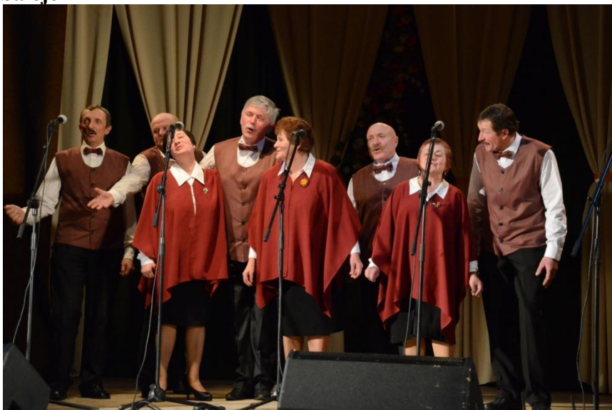
Kolektyvas iš Alantos pelnė žiūrovų simpatijas