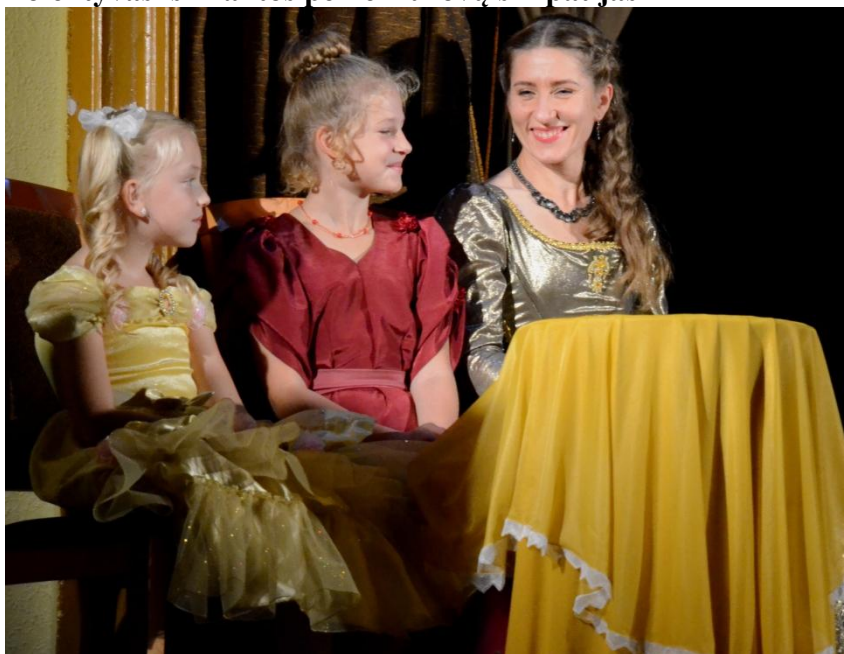
Linksmosios renginio vedėjos

ną, tai ir lakstau po laukus, pasišokinėdama kaip ožka ir dainuodama. Per radiją išgirdavau, žiūrėdama kino filmus. Anksčiau rodydavo daug indišų filmų, o juose ypač daug dainuojama, tai ir tas dainas bandydavau pakartoti, nors kiek aš ten suprasdavau! Bet dainuodavau – dainos labai anksti užpildė visą mano gyvenimą.