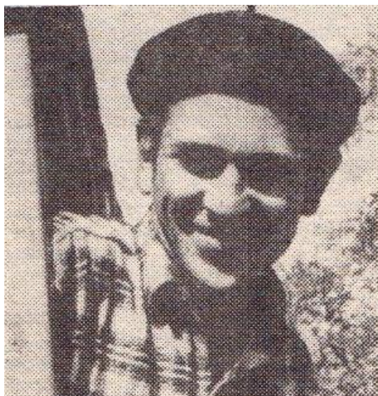
P. Ivanauskas.