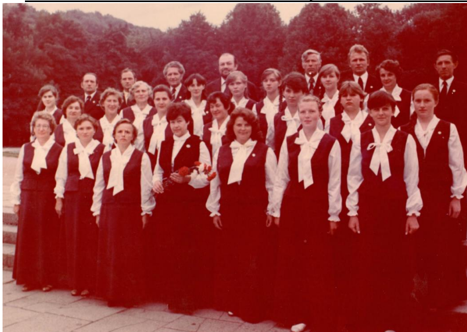
Tauragniškiai respublikinėje dainų šventėje. 1985 m.

kas. Tokio tipo dainos, kokias jie dainuoja, man labiausiai patinka. Pop muzikos nemėgstu. Operinės dainos labai patinka. Kai klausau, atrodo, jos man visos žinomos. Ir liaudies dainos labai prie širdies. Labai mėgstu gražias lyrines dainas, bet vienos išskirti niekaip negaliu – jų tiek daug“.