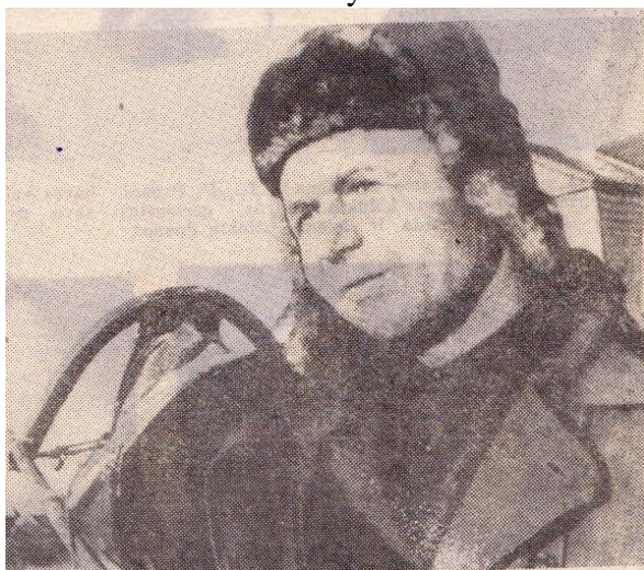
----- Ne vien duona... Gegužės 29 d.