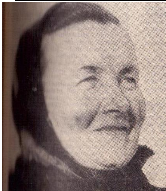
----- Atkaklumas darbe padeda Birželio 5 d.