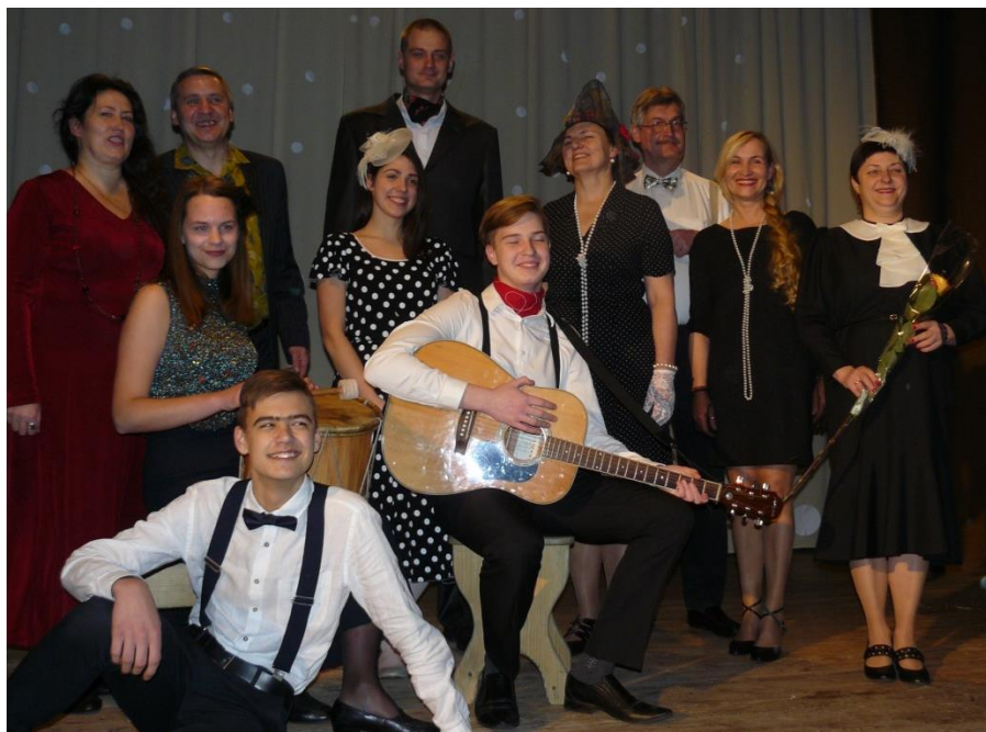
Ansamblis dainavo ir romansus