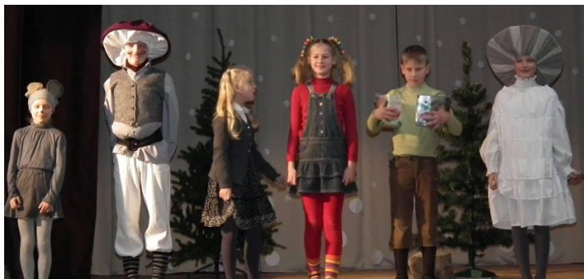
Iš kokių mes knygų?