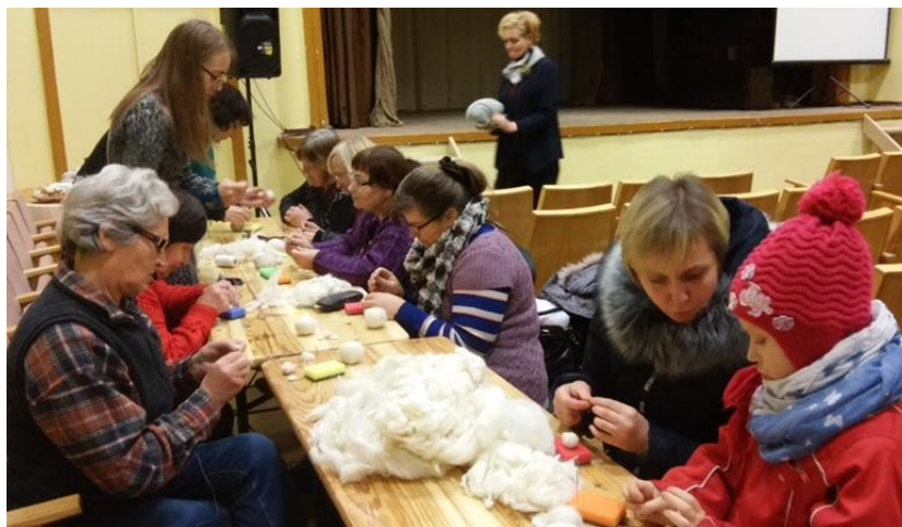
Praktinio užsiėmimo metu