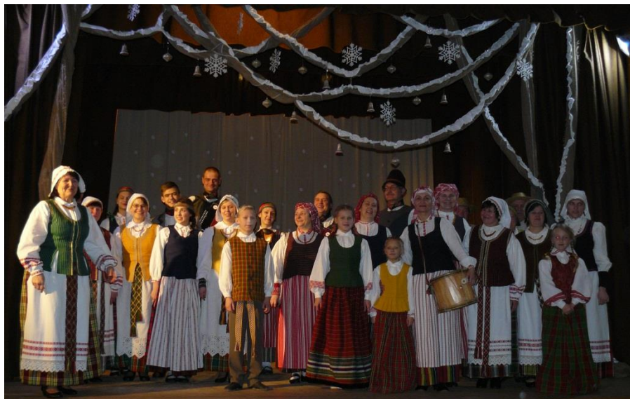
Bendra aukštaičių ir žemaičių nuotrauka

Ačiū visiems, dideliems ir mažiems. Viso projekto veiklos dar bus apžvelgtos kitame laikra-