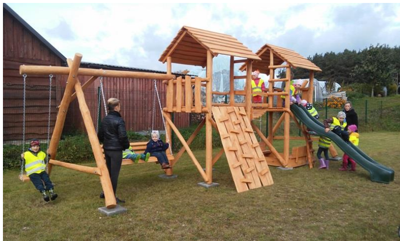
Aikštelę vaikai spėjo išbandyti

Prie sporto aikštyno įrengta vaikų žaidimų aikštelė, pastatyti keturi lauko treniruokliai, miestelio centre pastatytas stiebas vėliavai. Bendra projekto vertė 3900,75 Eur. Paramos suma – 3375,00 Eur. Tauragnų krašto bendruomenė prie projekto įgyvendinimo prisidėjo ir nuosavomis lėšomis (525,75 Eur).