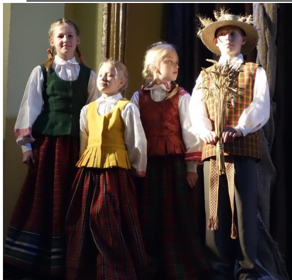
Mažieji tauragniškiečiai, folklorinio ansamblio dalyviai