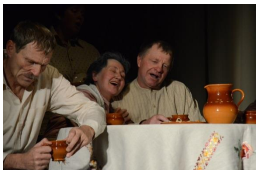
Scena iš spektaklio