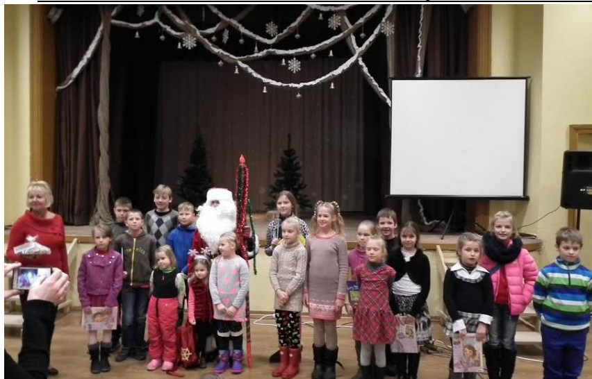
Su Kalėdų seneliu.