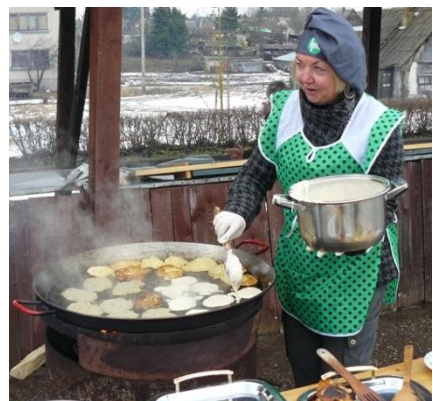
Šauniosios blynų kepėjos