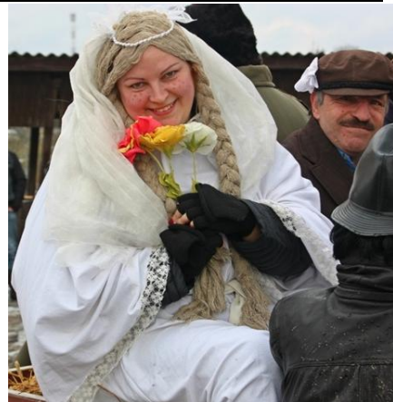
Gražesnių už jaunąją nebuvo