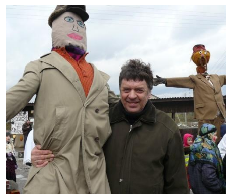
Gavėnai buvo bent trys!