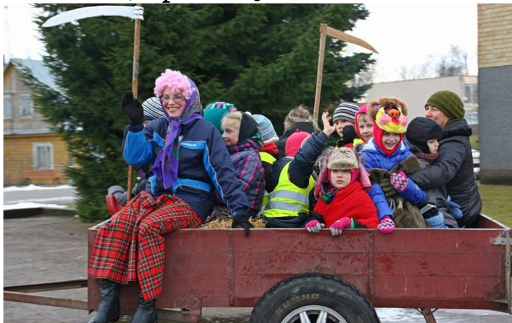
Išvažiuojam! Į kitų Užgavėnių!