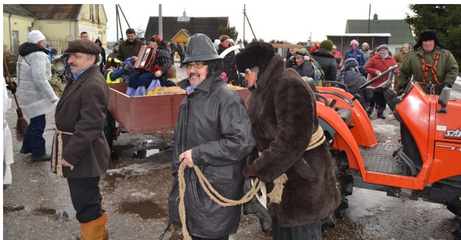
Čigonas kvietė galinėti su meška