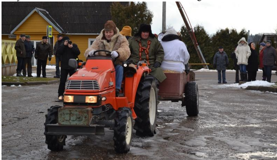
Į Užgavėnes su moderniu transportu. Arklių nebeliko...