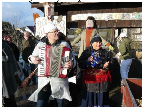
Pašydīm su muziką