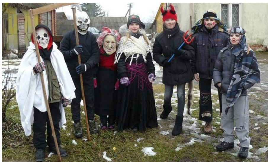
Ar atpažįstat jaunuosius Užgavėnių dalyvius?..