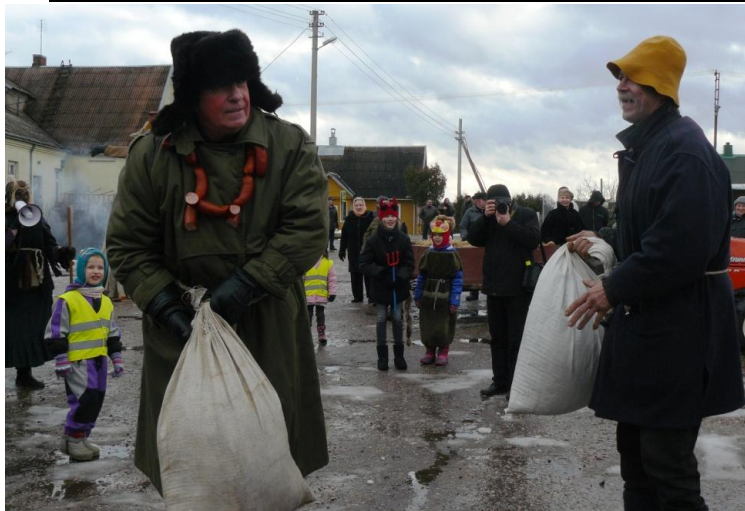
Lašininio ir Kanapinio dvikova