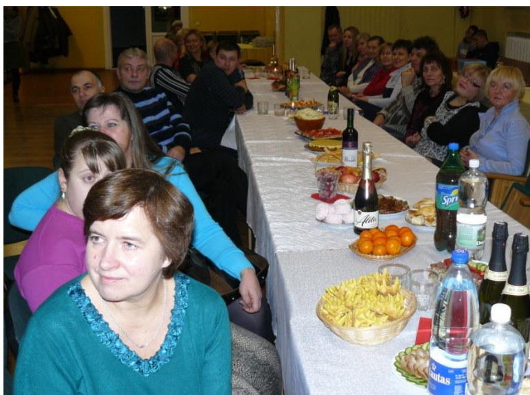
Programą stebėti buvo įdomu

Nežinau, kaip Jūs, bet aš visada laikiu Kalėdų. Snieguolė juk turi jų laukti! Nesvarbu, kad dažnai Kalėdos nebūna baltos, bet šventę susikurti galima. Man patinka Kalėdos Tauragnuose. Tiesa, šiais metais buvau truputį išsigandusi, net su Kalėdų seneliu savo baimėmis pasidalinau – kultūros centro salė, kur bendruomenė turėjo švęsti, laukti Kalėdų senelio ir dovanų, atrodė tuštoka. Gal per purvą nesislorėjo eiti iki kultūros centro, bet juk visur šaligatviai (tiesa, pastebėjau, kad daug tauragniškių mieliau