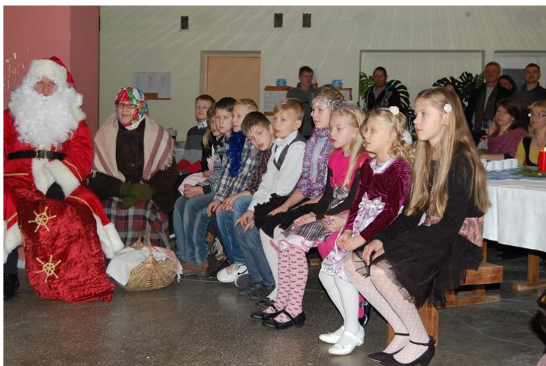
Prie Kalėdinės eglutės mokinukai ir darželinukai