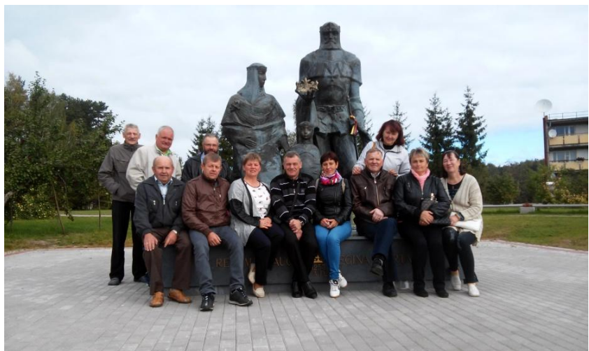
Prie paminklo karaliui Mindaugui ir jo žmonai Mortai

Turbūt ne mažesnį išpūdį mums paliko už poros kilometrų esantis Karalių kalnas, užimantis per 20 ha žemės plotą. Prieš dešimt metų čia buvo apleista pelkėta vieta, o šiandien gausiai