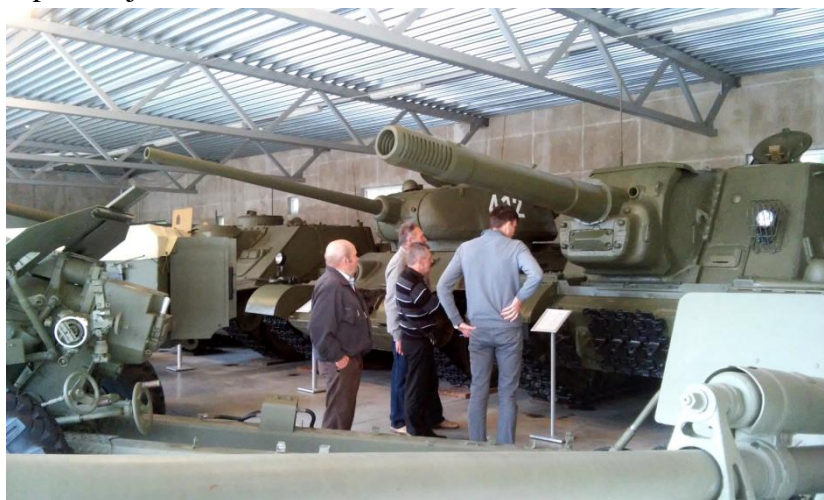
Karinės technikos muziejuje; Agluonos bažnyčia; Prie angelo