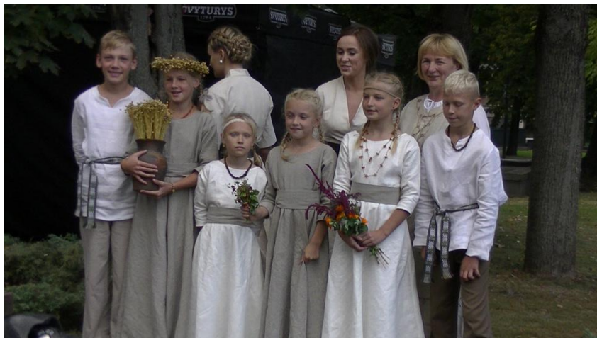
Vilniuje, Tautų mugėje

lio 21 valandą buvom Tauragnuos. Taip mes praleidom įdomų, įsimintiną penktadienį.