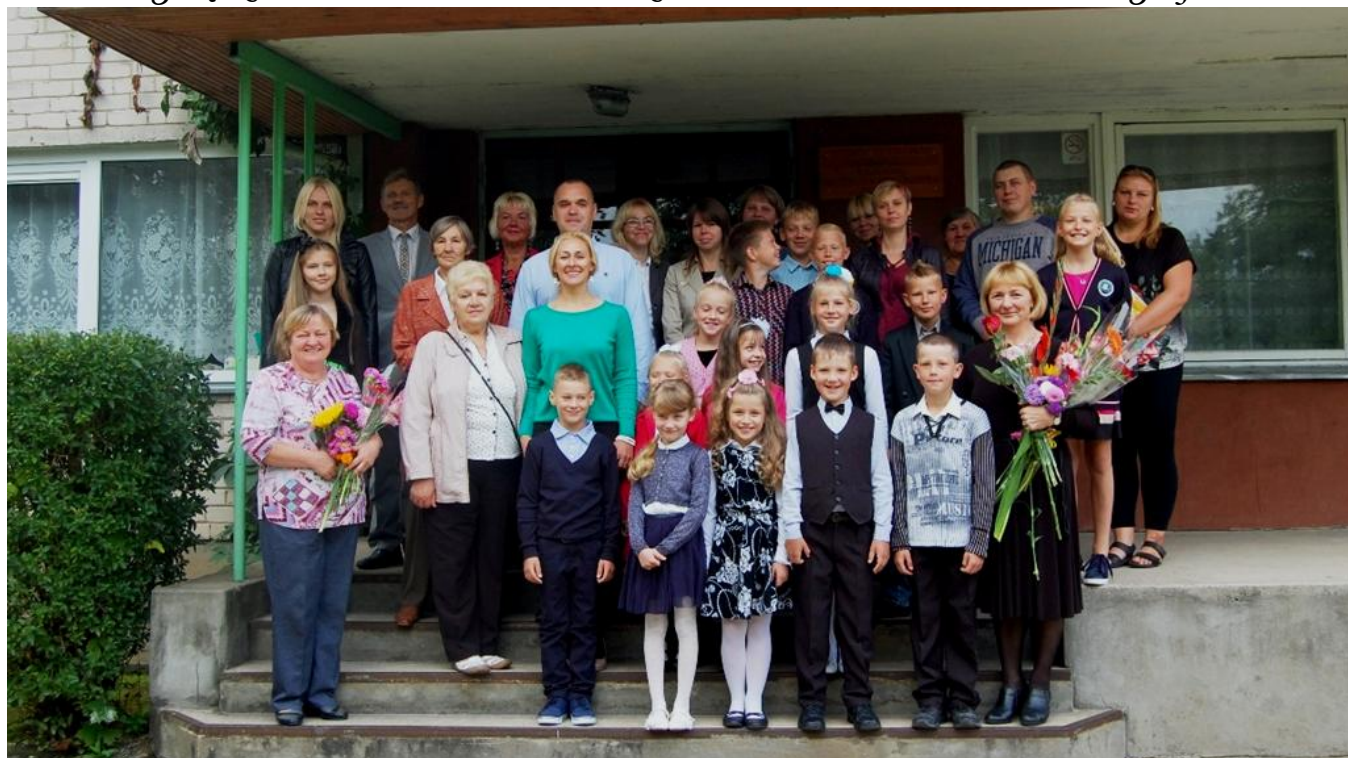
Rugsėjo 1-oji Tauragnuose