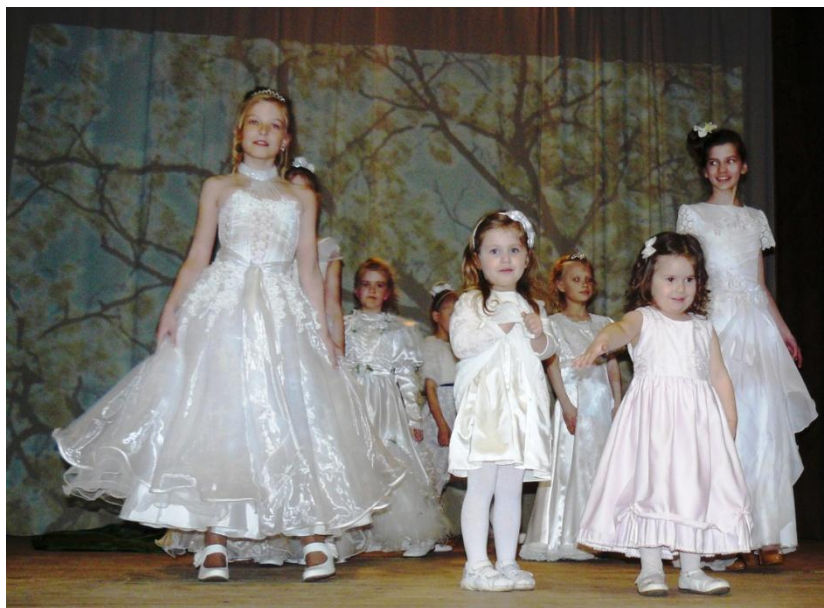
Scenoje – mažųjų modeliukų mokyklos mergaitės

Smagu, kai šventę po kruopelytę suneša visi. Juo labiau, kad Kultūros diena – visų mūsų bendra šventė. Prie kultūrinio miestelio gyvenimo vienaip ar kitaip prisidedame daugelis iš mūsų.