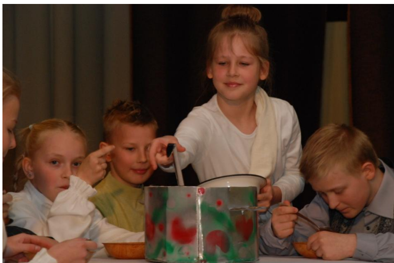
Scena iš spektaklio

Vėliau į sceną lipo darželio vaikučiai, kurie mamoms skyrė gražiausius žodžius, daineles ir dovanėles. Ir visai nesvarbu, kad susiklausymo ir rimties mažiesiems, aišku, trūko, viską atpirkio jų nesužadintas nuoširdumas.